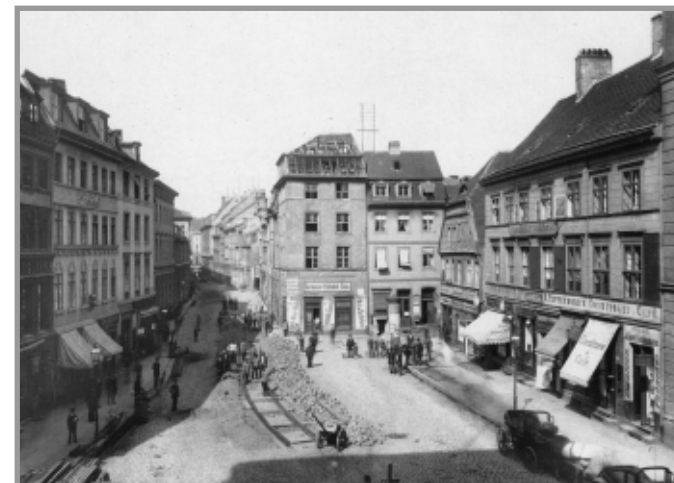
3 Köllnischer Fischmarkt