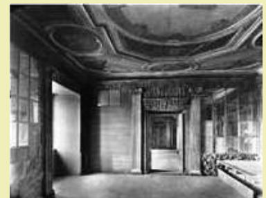
Naturalienkammer (Raum 990)