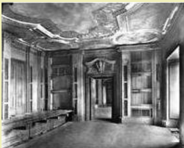
Elfenbeinzimmer (Raum 989)

Link zum Gesamtgrundriss 3. Obergeschoss