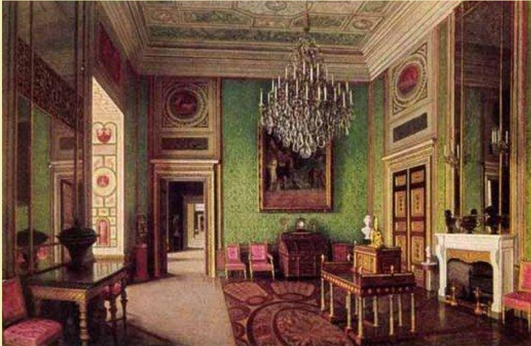
Blaue französische Kammer, Raum 553 Entwurf und Bauleitung von Friedrich Wilhelm von Erdmannsdorff