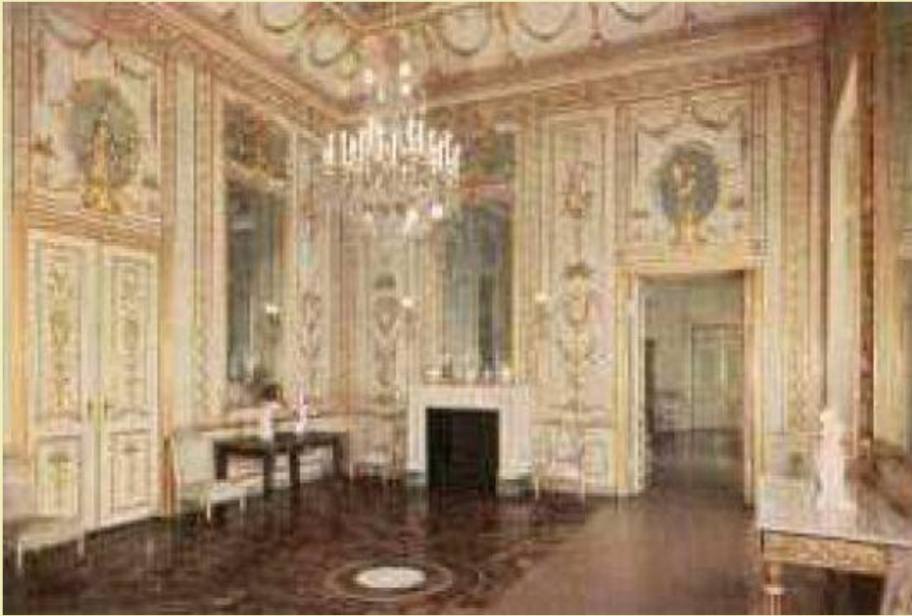
Parolesaal, Raum 557 Entwurf und Bauleitung von Friedrich Wilhelm von Erdmannsdorff