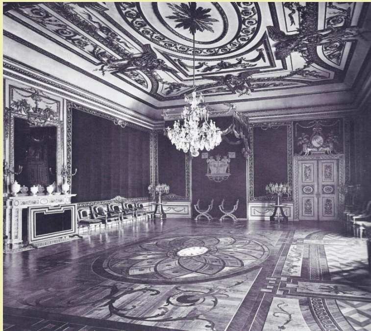
Weißes Zimmer, Raum 558 Entwurf und Bauleitung von Carl Philipp Christian von Gontard