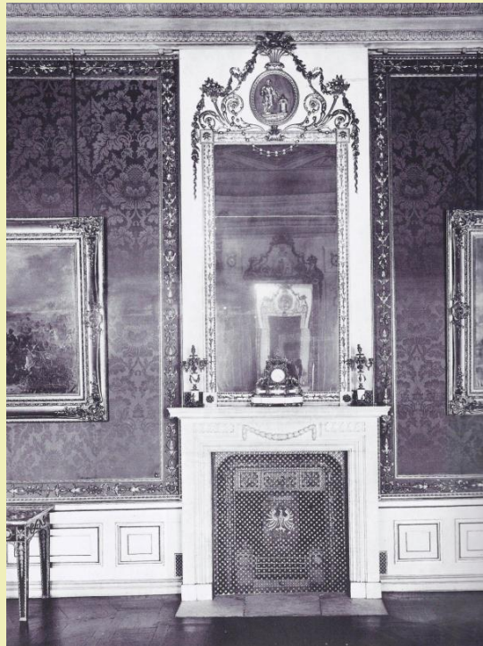
Gründamastene Kammer, Raum 565 Entwurf und Bauleitung von Carl Philipp Christian von Gontard