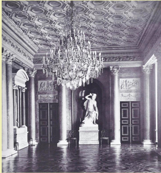
Speisesaal, Raum 555 Entwurf und Bauleitung von Friedrich Wilhelm von Erdmannsdorff